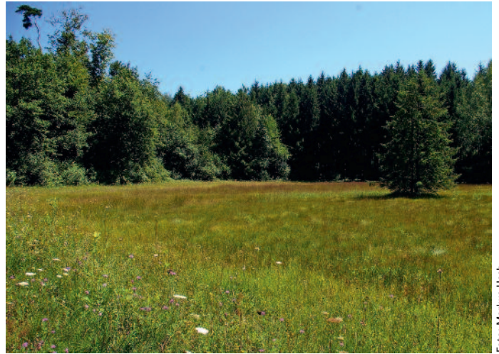
Waldrand und Riedwiese Glaserweid

■ Ein Projekt zur Förderung des Blauauges ( Minois dryas ) im Knonauer Amt ist von Erfolg gekrönt. Emil Stierli und Eugen Pleisch hatten während der kantonalzürcherischen Tagfalterkartierung von 1990 bis 1992 im Gebiet Arbach-Rorholz-Grabenmoos-Foren in den Gemeinden Kappel und Rifferswil einen kleinen Bestand des Blauauges festgestellt. Sie entschlossen sich, ein Artenförderungsprojekt für diesen Falter zu lancieren. Die Ziele setzten sie zusammen mit Vertretern der Fachstelle Naturschutz Kanton Zürich fest: Die verschiedenen Riedwiesen sollten vernetzt und vom Blauauge besiedelt werden.