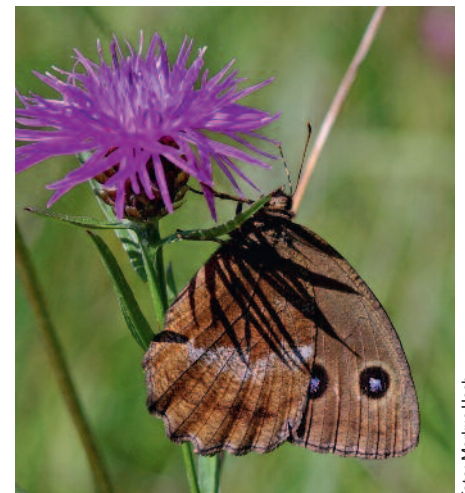
Blauauge ♀ ( Minois dryas ) auf Wiesen-Flockenblume ( Centaurea angustifolia )

Als Blütensaugpflanzen: Schmalblättrige Wiesen-Flockenblume ( Centaurea angustifolia ), Wasserdost ( Eupatorium cannabinum ), Blut-Weiderich ( Lythrum salicaria ), Sumpf-Ziest ( Stachys palustris ), und Abbisskraut ( Succisa pratensis ).