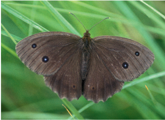
Blauauge ♂ ( Minois dryas )